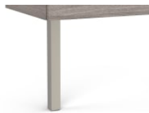
Conjunto de dos patas opcionales